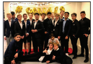
Skønne fotos af 9. årgang fra deres gallafest.